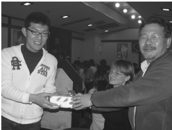
（左が森下さん、右が日置先生）