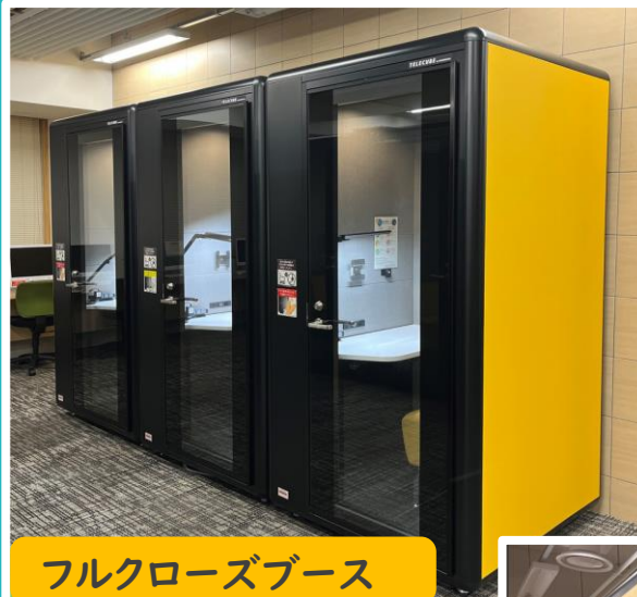
フルクローズブース