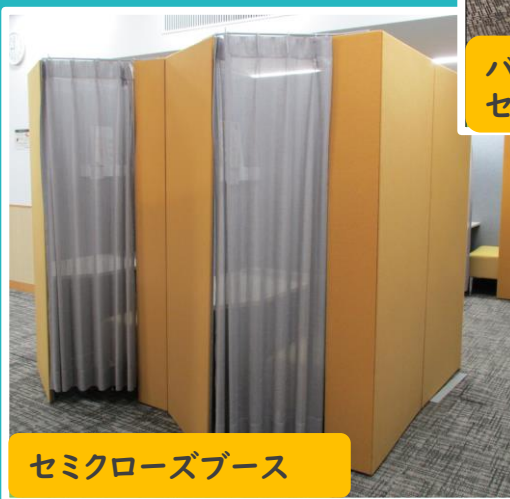
セミクローズブース