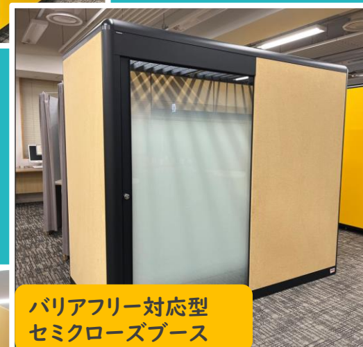
バリアフリー対応型 セミクローズブース