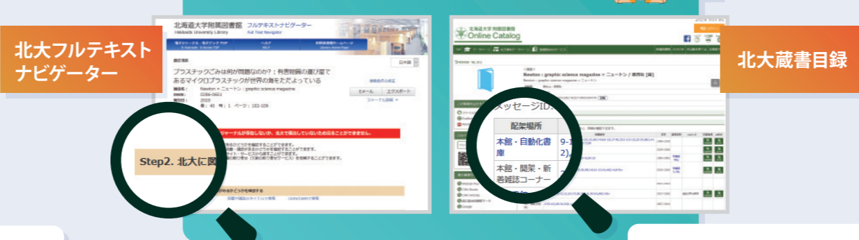
北大フルテキスト ナビゲーター