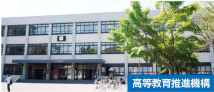
高等教育推進機構