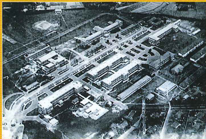
(上) 台湾のサトウキビ畑 (1927年撮影、星野勇三旧蔵写真/大学文書館蔵)