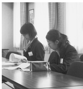
図書館の概要について聞き入る武蔵女子短大(左)と藤女子大(右)の実習生たち