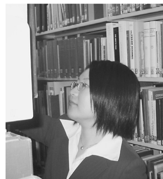
書架点検を行なう実習生

この実習は，これから始まる就職活動や，それから先の将来にも活かすことのできる，活かさなければならぬ，自分にとって本当に実りあるものであった，と心からそう思っています。